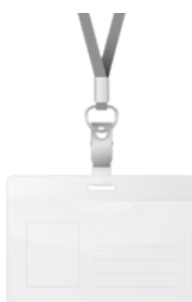
Drzac kartice horizontalni