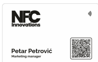
Bela mat sa crnom štampom