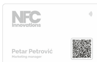
Bela mat sa srebrnom štampom