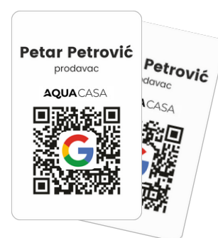
Review ID kartica