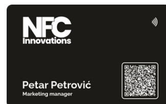
Crna mat sa belom štampom