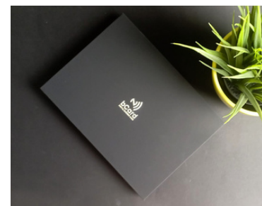
Ukrasna kutija 2000.00rsd+pdv