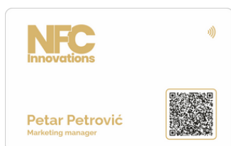
Bela mat sa zlatnom štampom